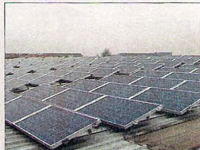
Instalación de conexión a red de 75 kW en Gatafe (Madrid).