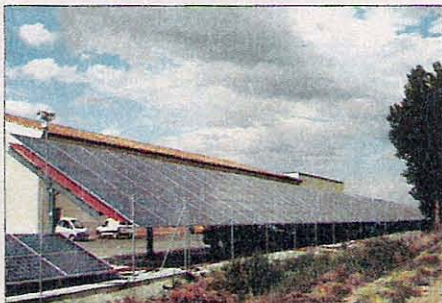
Instalación de conexión a red de 100 KW en Villanueva de Duero.